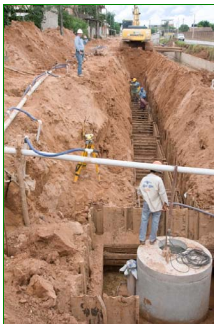
Foto n° 1. Construcción del sistema de alcantarillado sanitario del Plan Tres Mil