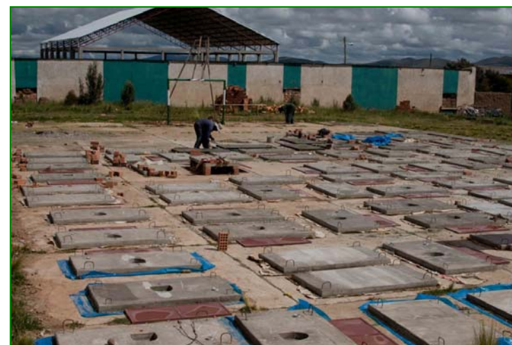
Foto n° 2. Construcción de losas de hormigón para baños ecológicos en Cuéllar-Taypichuro