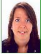
Por ELISENDA ALBA PLA, colegiada nº27.941 [AGBAR]