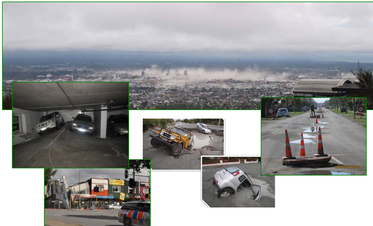
The February 22, 2011 South Island, New Zealand Earthquake Nube de polvo creado minutos después del terremoto

Ministerio de Terremotos (CERA), el Ministerio de Transportes (NZTA) y las mayores compañías de construcción y consultoría del país para llevar a cabo la total reconstrucción del abastecimiento, saneamiento y pluviales en la ciudad. El reto y el proyecto es impresionante, reconstruir una ciudad por la cantidad de $2 billones de dólares neozelandeses (sólo en cuanto a las conducciones se refiere), con una producción media de 40$M/mes en proyectos. Para un ingeniero es una experiencia de enorme valor.