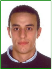
Por MIGUEL ESCUDERO POBLACIÓN, coleg. nº30.065